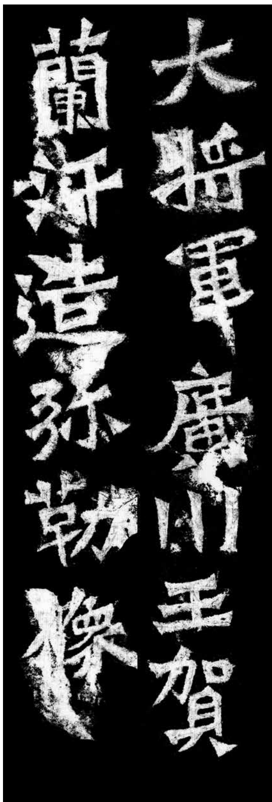
大將軍廣川王賀蘭汗。造弥勒像